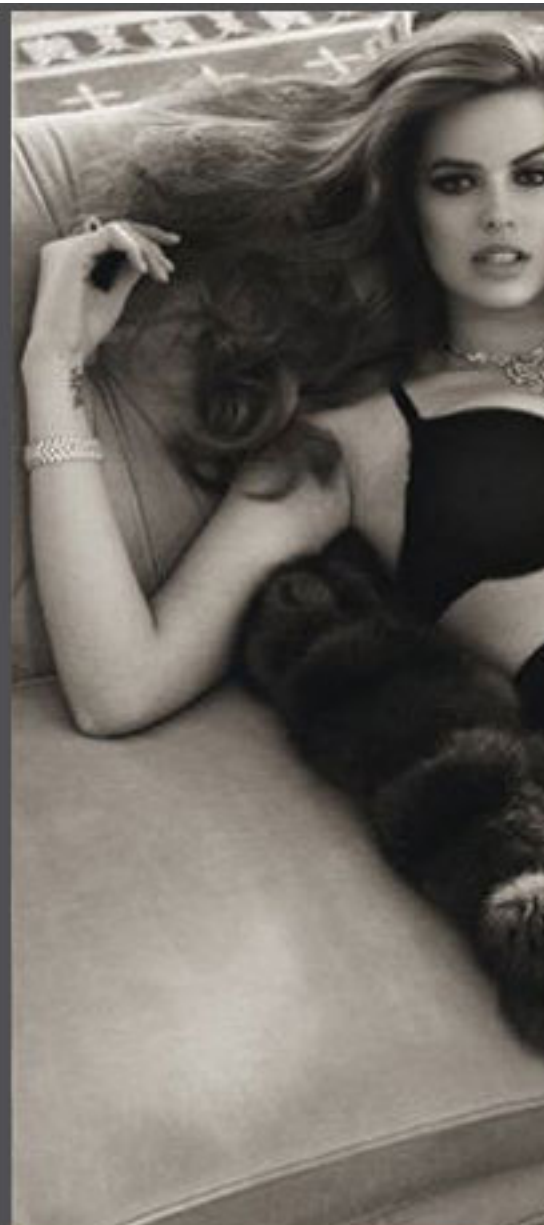
Взгляд на нее через плечо.