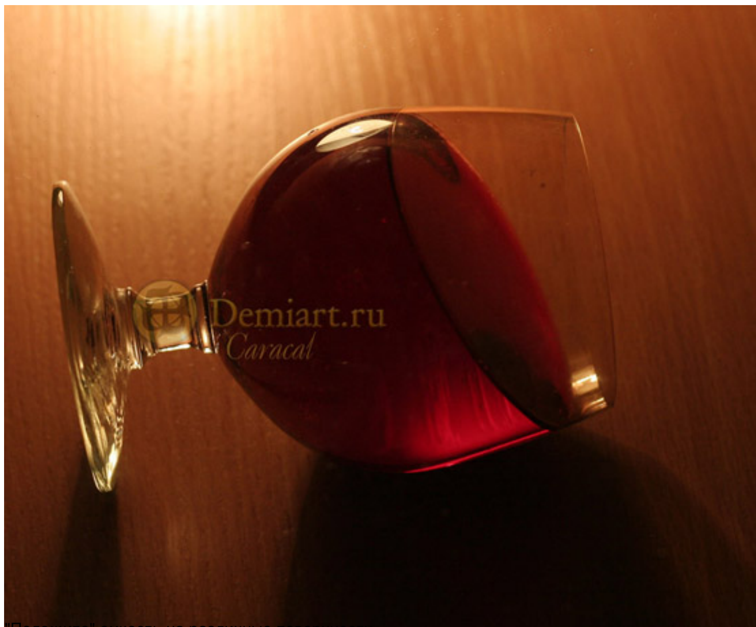
"Положите" емкость на различные поверхности