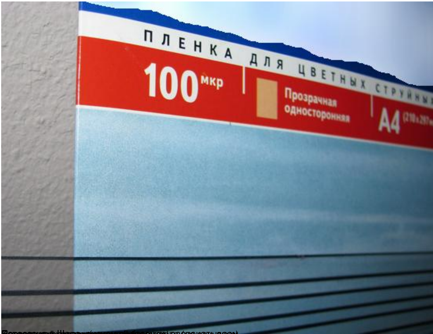
Вид сверху на пленку (односторонняя) для струйной печати (плавающая)